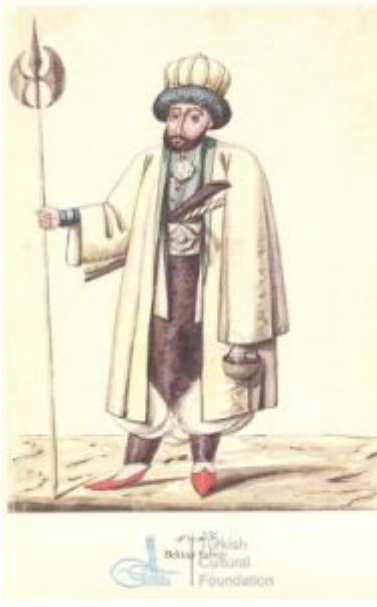
(Elinde teberiyile bir Bektashi dervişi tasviri)

Tarihimize medrese - tekke , Kadızade - Sivasi, molla - derviş çatışmaları olarak adlandırılan toplumsal çatışmalar sıkıntılı dönemlerde sığınacak bir liman arayışıyla farklı limanlara demirleyerek ayrışan halkın çatışmasıdır. Şunu belirtmek isterim ki, medrese-tekke çatışması olmasaydı, o dönemdeki tekkeler bugün olduğu gibi o günlerde medreseleşseydi (geleneksel medrese anlayışıyla tekke anlayışının sentezinden bugün ucubelikten başka bir sonuç ortaya çıkmamıştır.) bugün Türkçe bu kadar güçlü bir dil olamazdı çünkü Türkçeyle beraber Türklük şuuru ve kimliği de yüksek ihtimalle kaybolurdu.