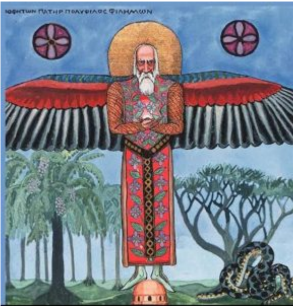
(Gnostisizm'i temsil eden bir figür)

Bu durumun bir benzer örneği de tarihteki Almanya'da olan reformist-gelenekselci, Protestan-Katolik çatışmasıdır. Alman kimliğini ve dilini öne çıkaran unsurlar bu çatışmaların sonucu olarak güçlenmiştir. Eğer Alman halkı reform süreci ve Protestanlaşma sürecine girmeseydi tahminimce bugün Avrupa'daki Katolik ülkelerden birinin sığıntısı olarak varlığını sürdürürdü.