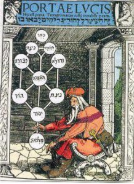
(Kabalaist bir Yahudi tasviri)

devriminden sonra komünistleşen Rusya halkları bozulmuş inançlarından uzaklaşınca manevi bir boşluğa düştüler. Din , hristiyan toplumunun önemli bir kesiminin sadece Noel ve Paskalya bayramlarının kutlandığı bir gelenek olarak algılanmaya başladı. Bu boşluk hedonist yaşam tarzını beraberinde getirdi.