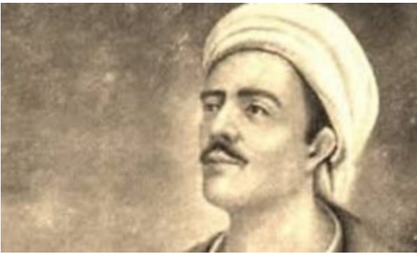
(Yunus Emre tasviri)