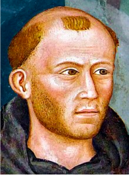
(Meister Eckhart'ın bir tasviri)